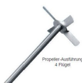
Propeller-Ausführung 4 Flügel