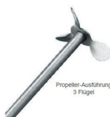
Propeller-Ausführung 3 Flügel