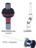
Basismodell aus Gummi Edelstahl PTFE / Polyamid

Weitere Propellerrührer in Edelstahl und Teflon: Preise auf Anfrage Kupplungen und spezielles Stativmaterial: Preise auf Anfrage