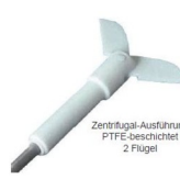
Zentrifugal-Ausführung PTFE-beschichtet 2 Flügel