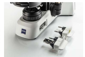
Beispielbid, Angebot ohne Kamera

Art. Nr. 464155010041 2.094,00 € 2.491,86 € Listenpreis 1.926,48 € 2.292,51 € unser Preis