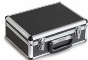
Transport- und Aufbewahrungskoffer ORA-A1102