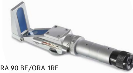
ORA 90 BE/ORA 1RE