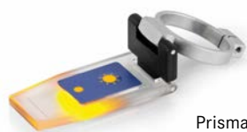
Prisma-Klappe mit LED ORA-A1101