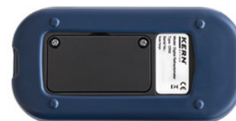
Rückansicht, verschraubter Batteriefachdeckel