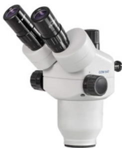
Kopf der Mikroskopserie OZM-5 (OZM 546, 547)