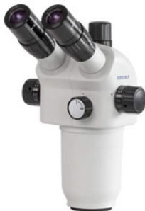
Kopf der Mikroskopserie OZO-5 (OZO 556, 557)