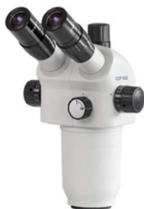
Kopf der Mikroskopserie OZP-5 (OZP 551, 552)