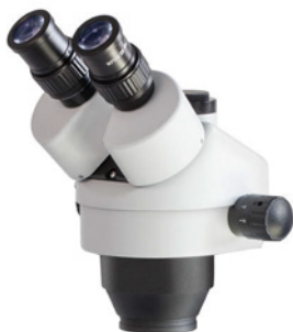
Kopf der Mikroskopserie OZL-46 (OZL 461, 462)